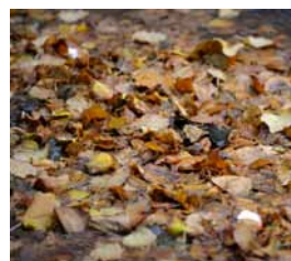
Boende varnar för lövhögar utanför ytterdörren.

Enligt uppgift har polisen kontaktat de berörda båtägarna.